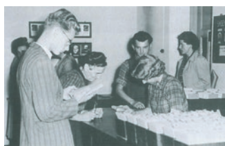
Uwe Johnson in der Güstrower Bibliothek, 1956

Die Auseinandersetzung mit ideologischem Zwang und politischer Gewalt – und die Hoffnung auf Besserung, da „auch die rücksichtsloseste Diktatur nicht die Seelen ihrer Opfer“ beherrschen kann.