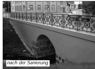
nach der Sanierung

Hageböcker Straße östlich des Bauwerks begonnen. In diesem Zusammenhang wurde eine Grundinstandsetzung mit einer, dem neuen Erscheinungsbild des Altstadtkerns angepassten, Umgestaltung der Brücke und seines Umfeldes vorbereitet. Mit den Arbeiten an der Brücke wurde im Jahr 2004 begonnen.