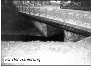
vor der Sanierung

Die Brücke Nr. 104 in den Wallanlagen der Stadt Güstrow überführt die Hageböcker Straße zwischen Neue Wallstraße und Lindenstraße/Schweriner Straße über den Stadtgraben.