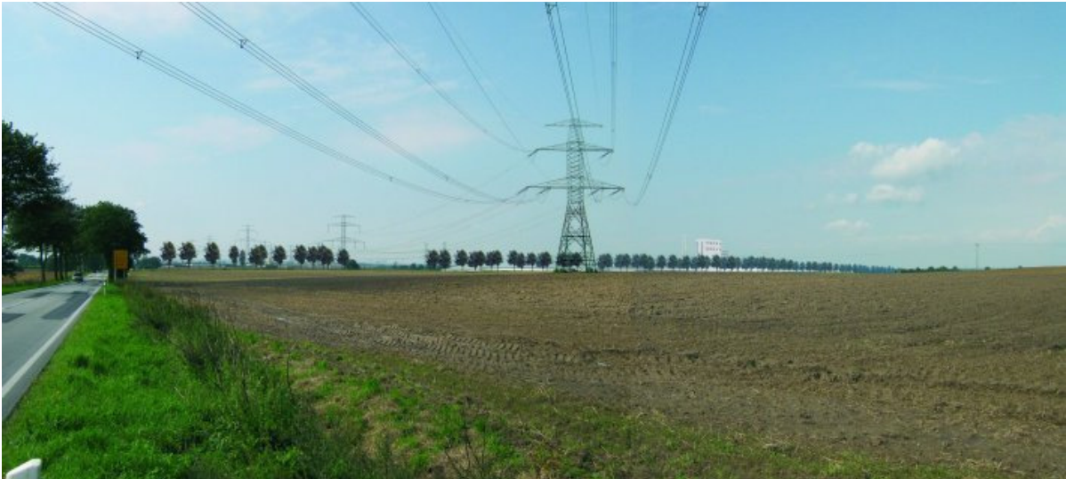
Abbildung 2-4 Ansicht auf den Bioenergiepark Güstrow in 10 bis 15 Jahren - Visualisierung aus Richtung B 103 (Ortseingang Güstrow)

Erhebliche Auswirkungen auf das Landschaftsbild können somit nicht vollständig vermieden werden.