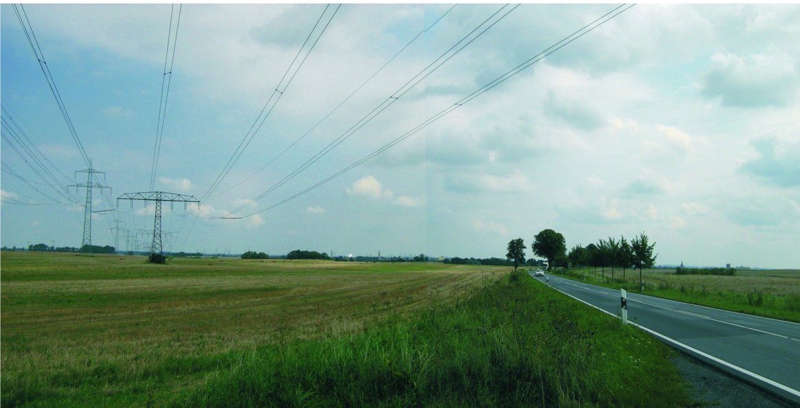
Abbildung 2-2 Fernansicht auf den Bioenergiepark Güstrow - Visualisierung aus Richtung B 104 aus Schwerin, höchster Punkt vor Kurve südlich des Grundlosen Sees