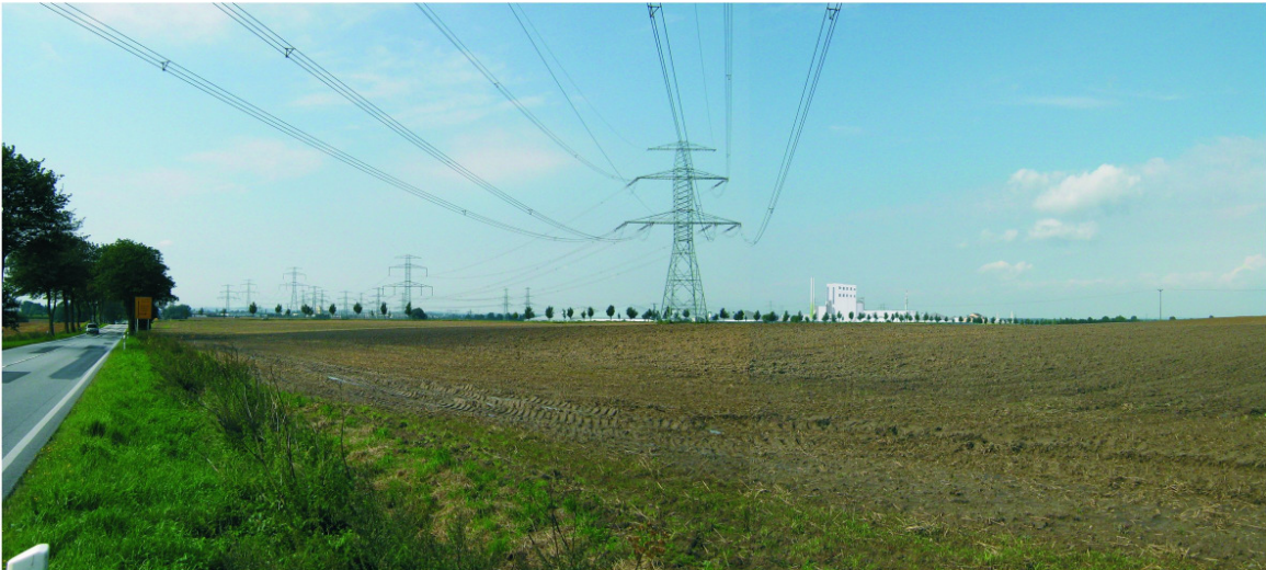
Abbildung 2-1 Ansicht auf den Bioenergiepark Güstrow - Visualisierung aus Richtung B 103 (Ortseingang Güstrow)