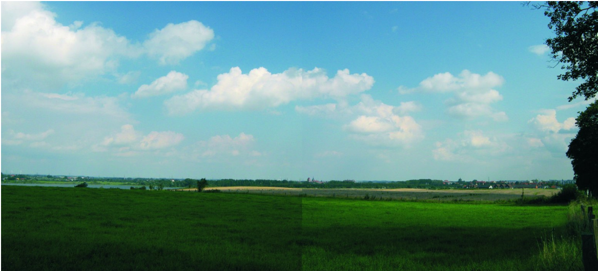
Abbildung 2-3 Fernansicht auf den Bioenergiepark Güstrow - Visualisierung aus Richtung B 103 aus Goldberg, höchster Punkt nach Gutow mit Blick auf Altstadt

Als mittelbare Folgewirkung kann es durch die potenzielle Zunahme des Maisanbaus (Hauptfestbrennstoff) in der näheren und mittleren Umgebung zu einer Modifizierung der Anbaustrukturen und somit des weiträumigen Landschaftsbildes kommen. Prognosen können hierzu jedoch nicht getroffen werden, da die dafür benötigten komplexen Basisdaten einem stetigen, marktorientierten Wandel unterliegen und derartige Betrachtungen nicht Bestandteil eines Umweltberichtes zu einem B-Plan-Verfahren sind.