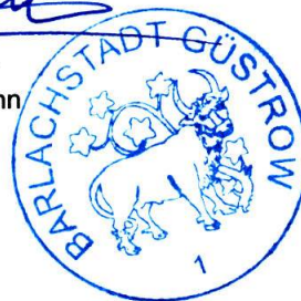
Der Bürgermeister Sascha Zimmermann